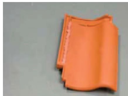
Tagstensklæben påføres langs hele sidefaldsen.