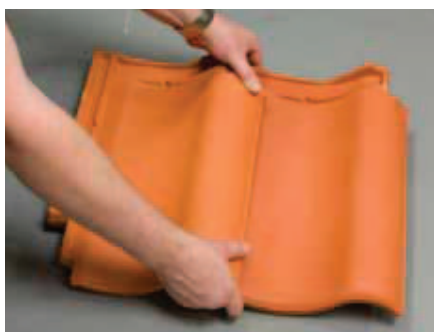
Tegstenene klemmes, evt. stavles oven på hinanden. Samles inden for 10 min.