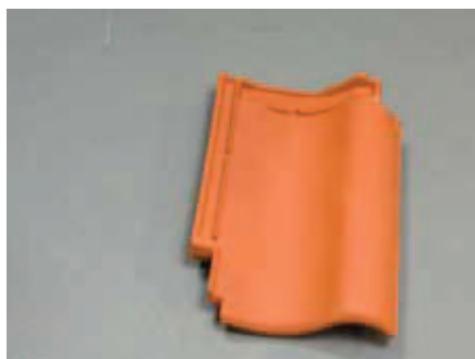
Tagstenene rengøres i samlingen.