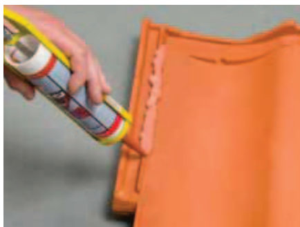
Tagstensklæben påføres på 100 % rene og tørre flader i sidefaldsen.