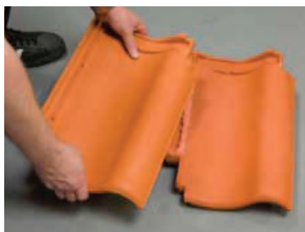
En ny tagsten lægges indover sidefaldsen og klemmes.